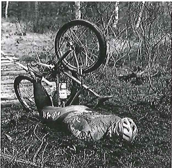
Bråstopp på kloppene etter Tutjern

nettstedet Kondis.no (med masse kule bilder) og denne artikkelen ble en av de mest besøkte på nettstedet i 2008.