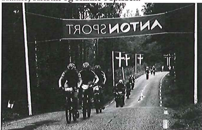
Grensepassering