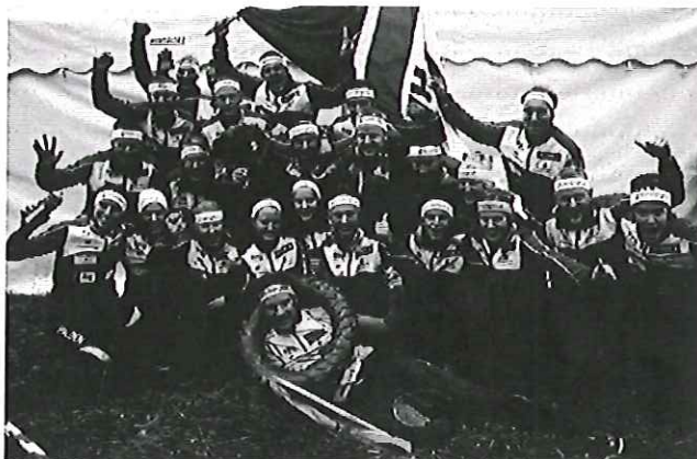
Seier i 25-manna i Stockholm